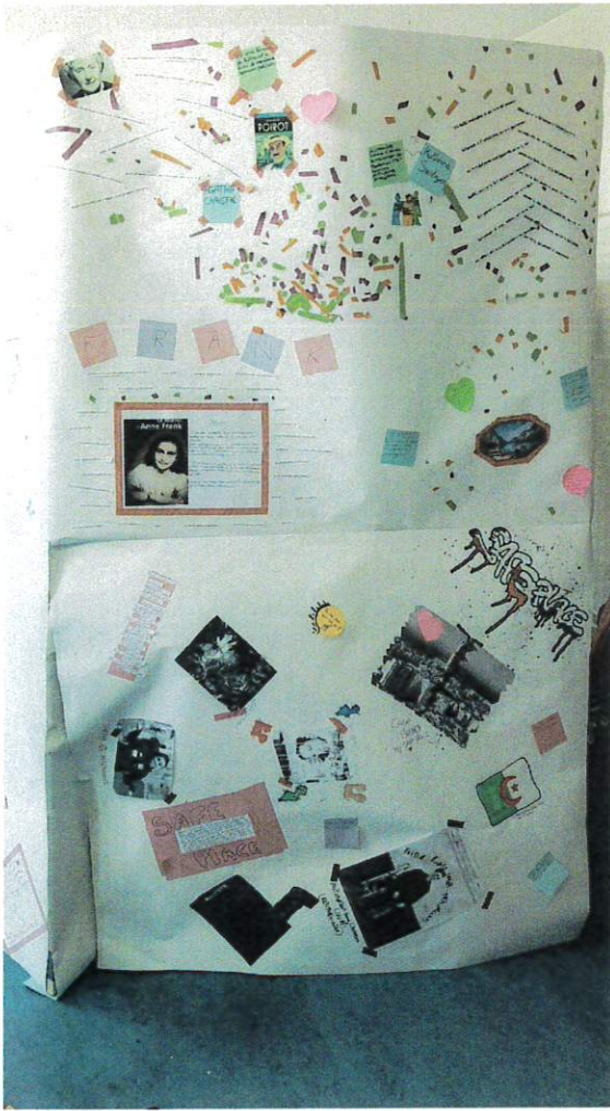
La safe place des 2°14 au CDI